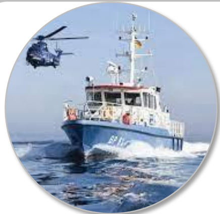
Gestione integrata delle frontiere