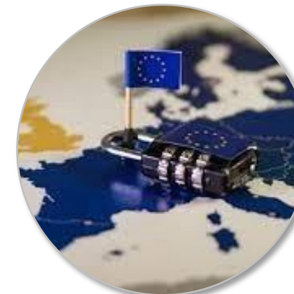
Vulnerability Assessments, Schengen Evaluations